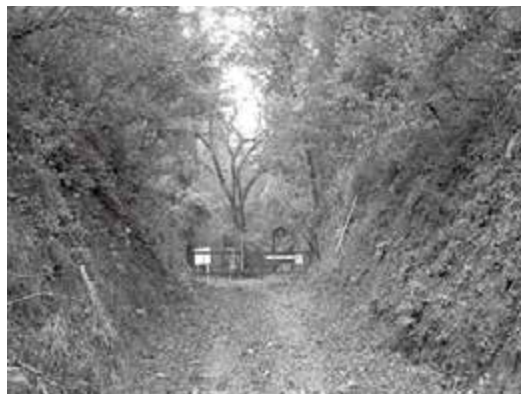
現在の地藏峠のようす

本海へ注ぎ込み、保津川・桂川の上流となる大堰川が北から南へ流れて淀川と合流し、大阪湾に注ぎます。