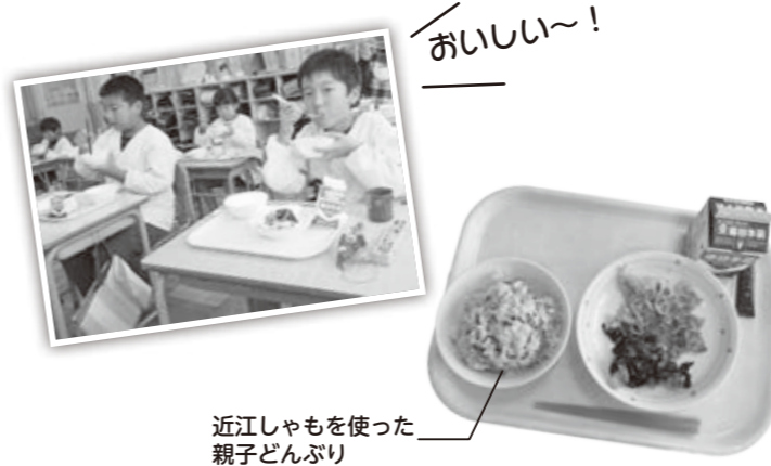
近江しゃもを使った親子どんぶり

10月14日（水）、市内小中学校の学校給食に、滋賀県の特産地鶏「近江しゃも」を使った親子どんぶりが登場しました。 これは、新型コロナウイルス感染症の拡大により、消費が低迷している近江しゃものおいしさや魅力をあらためて知ってもらうため、県が国の「国産農林水産物等販売促進緊急対策事業」を活用し