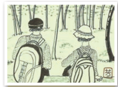
♪マキノ高原からセラピーロードをゆっくり歩いて丸太のベンチにドッコイショ! (頃常 芳子 今・今津)

スマートフォンや携帯電話などからの応募も大歓迎! また、市ホームページではカラーで掲載!