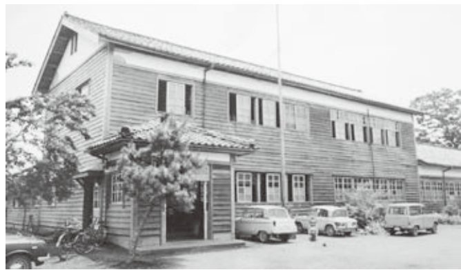
昭和40年頃の上弘部分校

学区を一部変更しながら、大正2年（1913）6月以降は今津尋常高等小学校の分教場、昭和30年以降は今津東小学校の分校（西校舎）となり、多いときには200人を超える児童が通学しました。