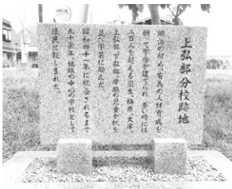
上弘部分校跡地記念碑

上弘部分校は、学制の施行により明治時代初期に設立された「生材学校」を前身とする今津東小学校の分校（西校舎）として使われていました。昭和41年（1966）に現在の今津東小学校に統合されるまで、藺生・梅原・大床・上弘部・下弘部・岸脇の子どもたちの学びの場となってきました。