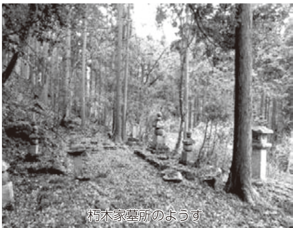
朽木家墓所のようす