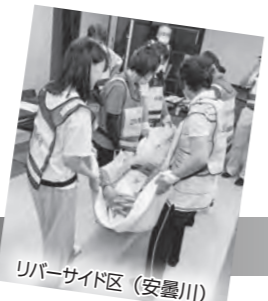
リバーサイド区(安曇川)