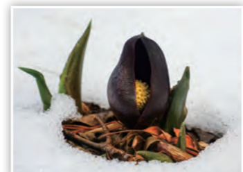
「こんにちは! ザゼンソウ」 雪の中からザゼンソウが顔をのぞかせたよ! 雪を溶かすザゼンソウの不思議な生態が見えたね。(しまK)