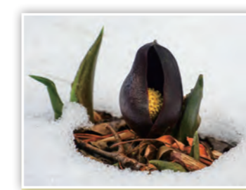
「こんにちは! ザゼンソウ」 雪の中からザゼンソウが顔をのぞかせたよ! 雪を溶かすザゼンソウの不思議な生態が見えたね。(しまK)