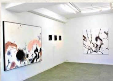
「Light and shadows」