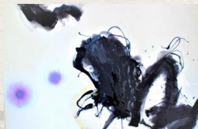
「そこにあるなにか」

多彩な画材を駆使し、階層や効果を重ねた抽象画を描く。等身大の立ち位置から、大きな自然に対する畏怖や日常の風景の曖昧さを、草花、風、光と影などの色や形を通して再構成する。