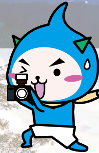
高島市公式インスタグラム イメージキャラクター「たかP」