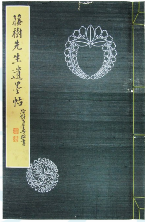
藤樹先生遺墨帖 藤樹頌徳会編 (中江藤樹記念館蔵)

また、同じく新規寄託の資料から、遺墨帖の編纂を手掛け、昭和初期に全国規模で藤樹顕彰活動を行った「藤樹頌徳会」の関連資料も併せて紹介します。