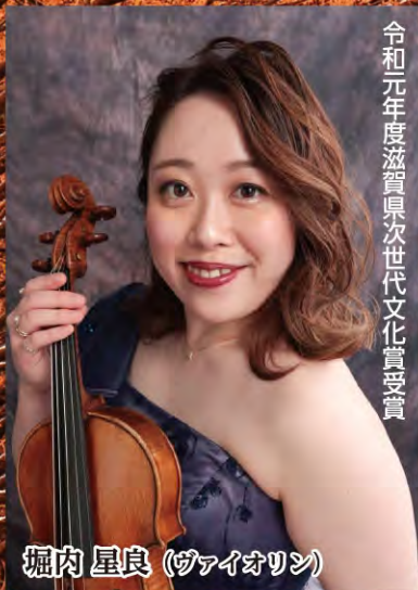
令和元年度滋賀県次世代文化賞受賞