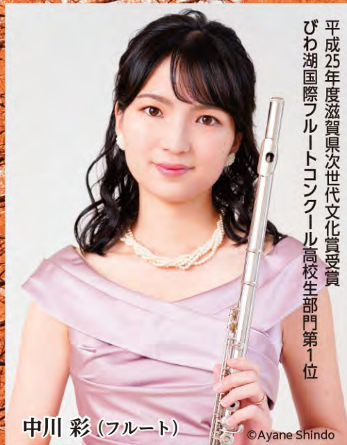
平成25年度滋賀県次世代文化賞受賞 びわ湖国際フルートコンクール高校生部門第1位