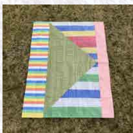
「レジャーシートのコラージュ」