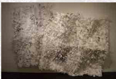
「都市のポートレート」