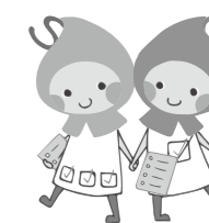
滋賀県健康づくりキャラクター ハグ＆クミ