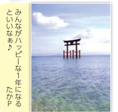
みんながハッピーな1年になるといいなあ♪ たかP

スマートフォンや携帯電話などからの応募も大歓迎! また、市ホームページではカラーで掲載!