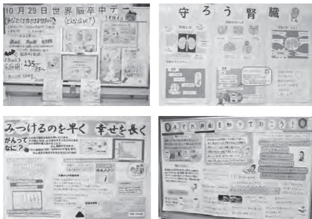
毎月各部署が交代でポスター掲示をしています

「医療・看護に関する情報ポスター」を知っていますか？ 高島市民病院1階エントランスホールに掲示している「医療・看護に関する情報ポスター」をご覧になったことはありませんか？ 情報ポスターには、病気に関することやケガの応急処置方法など、各部署が専門とする内容を分かりやすく掲載し、工夫を凝らしながら作成しています。 情報ポスターは、高島市民病院内健診センターにも掲示しています。ぜひご覧いただき、健康管理にお役立てください。