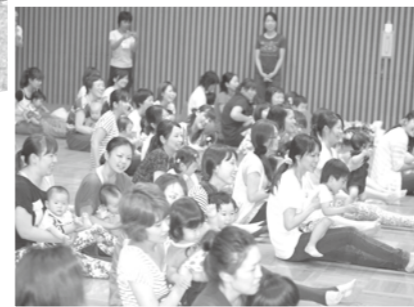
楽しみながら学ぶ 子育て講座♪

子育て支援センターは、子育て中の方々の地域全体で支援していくために、市内6か所の市立保育園や児童館に設置されています。未就園児とその保護者を対象に子育てに関する相談や、子育て支援活動などを行っています。たくさんのお母さんが参加されていますので、親子で遊びたいとき、子育てについて心配事があるとき、子育てに関する情報を知りたいときなど、気軽に足を運んでみてください。