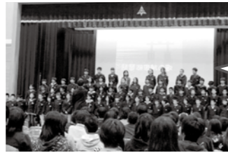
第1部(児童生徒の発表) 今津中学校区 75名による合唱の様子

このコーナーに対するご意見等は、高島市教育委員会事務局教育総務課 ☎(32)1132 までお気軽にお問い合わせください