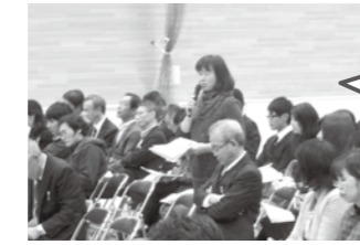
各中学校区で取り組む実践とその成果を参加者から紹介

フォーラムの第1部は、児童生徒が外国語活動・英語科の学習発表や中学校区の小中一貫教育の取り組みについての報告を行いました。高島市の子どものたちの姿を見て、小中一貫教育における教科指導や生徒指導