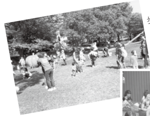
歩いてうきうき ミニ遠足