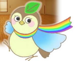
マスコットキャラクター エールちゃん

英語の「エール (yell)」には、「声援」や「励まし」の意味があります。がんばる子どもたちやご家族を、全力で応援するセンターを目指します。また、フランス語の「エール (aile)」には、「翼」という意味があります。子どもたちがそれぞれの色に光輝き、未来に羽ばたく姿をイメージしています。