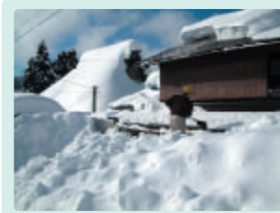
「雪が降りてくる屋根雪。少しづつ除けるしかありません」