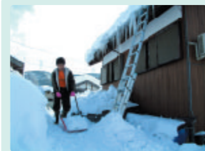
「除雪の手伝いに、市外で働く息子さんも帰って来られました」