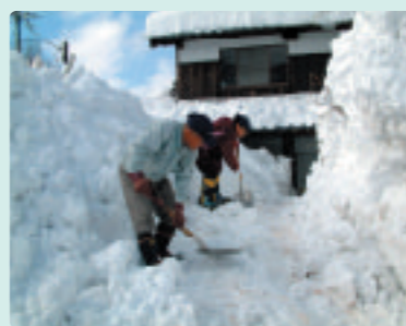
「まじの宝物」手作業の除雪を続ける「夫婦」

今年は今月末から記録的な大雪続き。皆さん、雪かき、屋根雪下ろしに大変な思いをされていると思います。 今月は、市内でも雪深いマキノ町在原地区の除雪作業の様子を紹介いたします。市内でも除雪中の事故等が報告されています。皆さん十分に注意して作業してください。