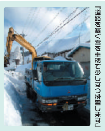
「道路を塞ぐ雪を重機で少しづつ排雪しなおす」

市役所にお届けいただく皆さんの様々な声。その中には市役所で解決できることもあれば、みんなが解決して行かなくてはならない問題もあります。このコーナーでは、そんな皆さんからいただく、声を紹介します。みんなが笑顔で暮らせるまちになるように、一緒に考えてください。