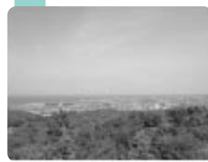
清水山城からの眺望

高島の地は、中世から戦国争乱の時代に高島衆(七頭、海津衆)や三浦衆(今津・海津・大浦の一向衆徒)と呼ばれる人々が活躍し、天下統一を目指す織田信長との攻防の舞台となり、越前の朝倉氏や湖北の浅井氏との闘ぎ合