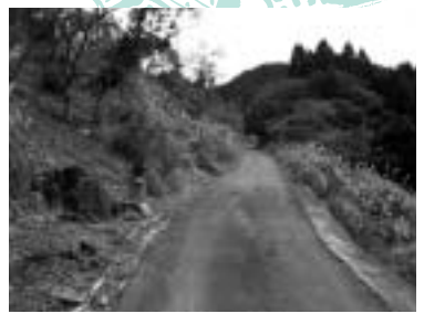
山中の関所跡付近

今津町から国道303号を西へ向かい、水坂トンネルを越えて福井方面へしばらく進むと、国道の左下に数件の家並みが見えます。ここは、江戸時代には「山中」と呼ばれた街道沿いの集落で、今津と小浜を結ぶ九里半街道中の唯一の関所である山中関がおかれていたことで知られています。 江戸時代、幕府は治安維持のために、全国の街道の要衝に関所を設けました。滋賀県は複数の街道が交差する交通の要衝であったため、九里半街道の山中関のほか、マキノ町には七里半街道の剣熊関、余呉町には北国街道の柳ヶ瀬関がおかれていました。 現在、山中の関所はその形跡を伝えてはいませんが、地元での言い伝えによると、集落内に近年まで残っていた「御茶屋」と呼ばれる民家が番頭の詰所で、関所はその東側にあったとされています。また、江戸時代 代に書かれた記録によると、山中関には番頭と呼ばれる武士2人が15日交代で詰めていて、ほかに中番2人と下番5人がいたとされています。また、関所が開けられるのは「明け六ツ(午前6時ごろ)」で、「暮れ六ツ(午後7時ごろ)」には閉められ、関所が閉まっている間は、急飛脚などのほかは、たとえ大名であっても通ることはできなかったと記されています。 現在の山中は住民の移動や家の建て替えなどが進み、その姿は変わりがつありますが、集落を通る旧街道の道筋と、それに沿って続く家並みの面影からは、関所がおかれ多くの旅人で賑わった村の様子がしのべれます。 (文化財課)