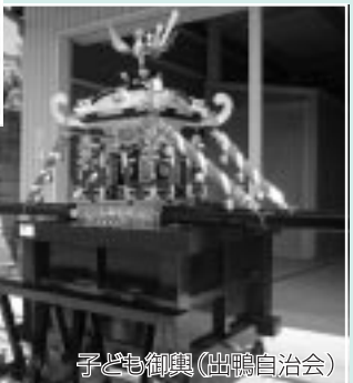
子ども御輿（出嶋自治会）