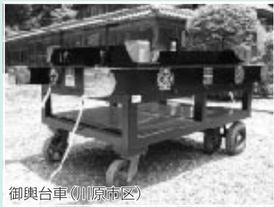
御輿台車（川原市区）