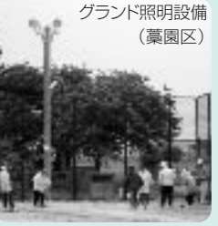
グラウンド照明設備(藁園区)