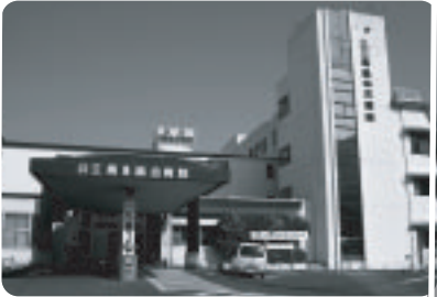
② 第1回高島地域医療整備検討委員会が開催されました。

【5月13日開催】 地域の会館や集会所などでかけて、市長と話しませんか。多くの市民の方と、まちづくりに直接お話をさせていただく機会として、懇談会の場を設けます。各区や団体(グループ)の事業として取り組んでいただきますようお願いいたします。テーマに合わせて市長に担当部局の職員が出席させていただきます。なお、開催にあたりましては、日程調整などが必要ですので、あらかじめテーマなどを決めて、秘書広報課までご連絡ください。