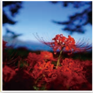
秋の訪れを告げるヒガンバナ。今年も綺麗に咲きますように♪ たかP

スマートフォンや携帯電話などからの応募も大歓迎!また、市ホームページではカラーで掲載!