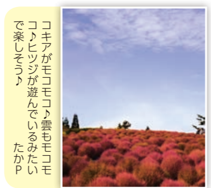
コキアがモコモコト雲もモコモコトヒツジが遊んでいるみたいで楽しそう! たかP

スマートフォンや携帯電話などからの応募も大歓迎! また、市ホームページではカラーで掲載!