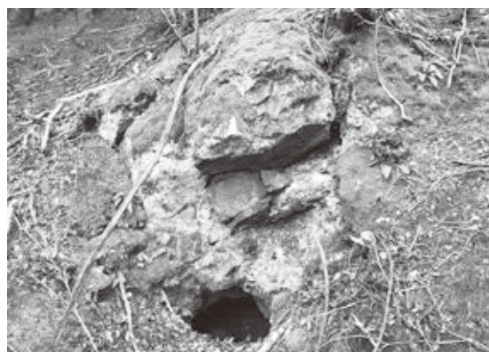
正行院（海津）裏山の横穴

ことから、古代の先端技術である鉄生産をつかさどっていた技術集団との関連性が想定されています。