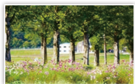
秋といえばコスモス♪ピンクにオレンジ、カラフルなコスモスがかわいいね! たかP

ハロウィンジャンボ5億円 ハロウィンジャンボミニ1,000万円 9月23日2種類同時発売!