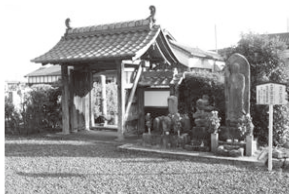
長盛寺山門と法界地藏さん