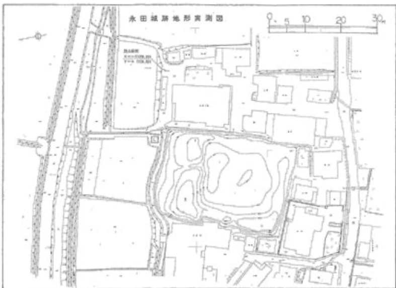
永田城跡地形実測図

上永田の集落を訪れると大きな森が2か所、目に入ります。集落の西側の森が※式内社の長田神社（祭神は水神の性格をあわせもつ事代主神とされる）で、北側の森が永田城跡にあたります。