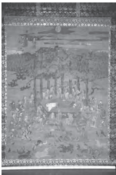
絹本着色仏涅槃図

半島を渡って6世紀半ばに飛鳥時代の日本に伝えられました。この教えは、当時の大和朝廷や有力豪族であった蘇我氏等に受け入れられ、奈良時代には全国に国分寺・国分尼寺が整備されました。市内では新旭町の大宝寺廃寺、藁園廃寺、今津町の大供廃寺、日置前廃寺などの白鳳・奈良時代の仏教寺院跡が確認