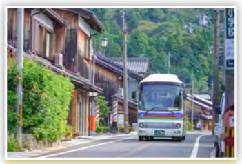
「バス出発!」市内を走っているタウンバス。みんなもぜひ乗ってみてな♪ (たかP)

スマートフォンや携帯電話などからの応募も大歓迎! また、市ホームページではカラーで掲載!