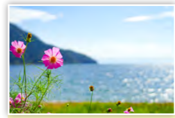
「コスモスとびわ湖」秋の代表的な花のコスモス。キラキラしたびわ湖と一緒に写って素敵やろ! (しまK)