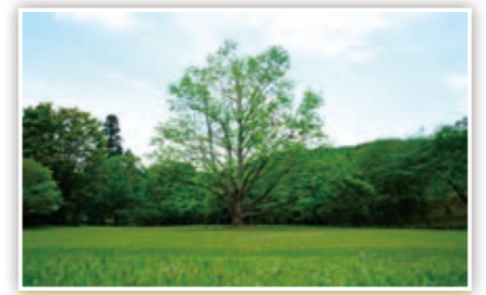
みずみずしい緑色とさわやかな風が気持ちいいなあ〜♪ たかP