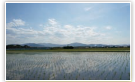
水を張った田んぼに青空が映って、まるで絵画みたい! たかP