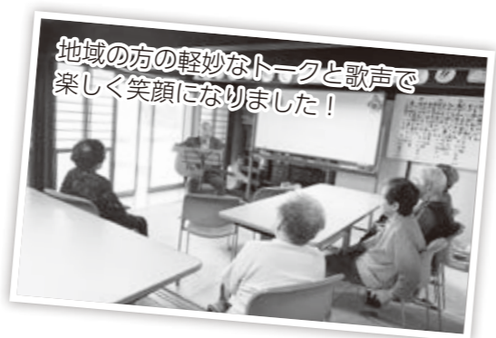
地域の方の軽妙なトークと歌声で楽しく笑顔になりました！