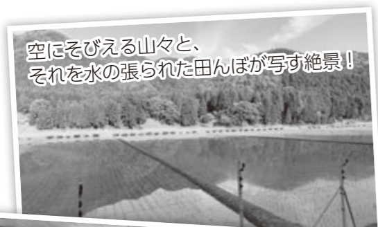
空にそびえる山々と、それを水の張られた田んぼが写す絶景！