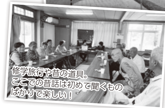
修学旅行や昔の道具。ここでの昔話は初めて聞くものばかりで楽しい！