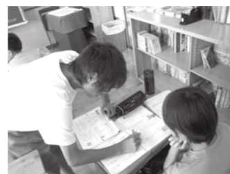
小中学生交流学習

市では、4年間、小中一貫教育の研究を推進し、本格実施に向けての体制を整えてきました。4月から、各中学校区で目指す子どもの姿を共有し、小中学校が一体となって、小中一貫教育を本格的にスタートします。