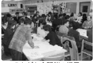
こんだん会開催の様子

現在市民の方から公募しました「高島市地域福祉市民会議」のメンバーの方が中心となり地域の課題解決に向けてご検討をいただいています。