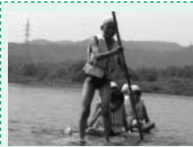
▲全校リバーウォッチング