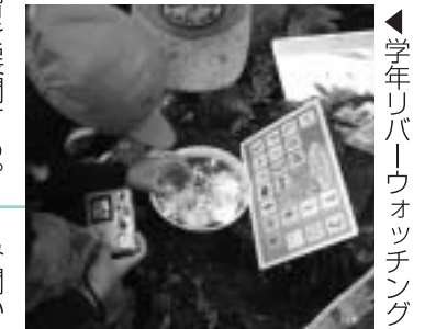
▲学年リバーウォッチング

と「学年リバーウォッチング」を行っており、次のとおり4つのねらいを設定して学習しています。 ①安曇川沿道（総距離60キロメートル）を6分割し、6年かけて踏破します。 ②五感を使って得た感動や疑問を大切に、課題解決学習を展開する。 ③学校周辺の川や安曇川に浸り、自然を身近に感じるとともに、思いを伝え合う力を培う。