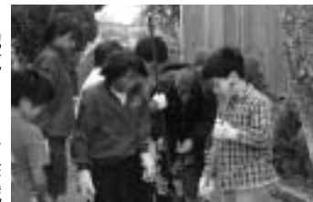
▶地域クリーン作戦

◆ブリッジタイム 地域の方から、地域の伝統行事・歴史・文化・産業・経済などを学び、その過程で人々の生き様に触れていきます。学習成果は文化祭で発表します。