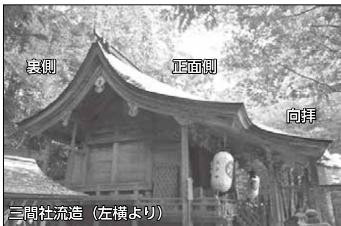
三間社流造（左横より）

新旭町饗庭にある波爾布神社は、社伝によると奈良時代に創立されたとされています。現在の本殿は、棟札（建物の建築・修繕の記録を記したもの）から元和10年（1624年）の建立で、その後幾度かの修繕・改修によって現在