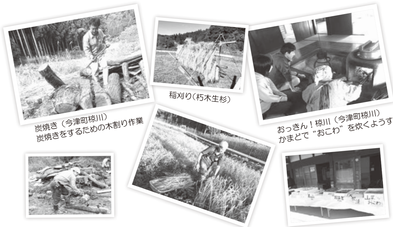
炭焼き(今津町椋川) 炭焼きをするための木割り作業