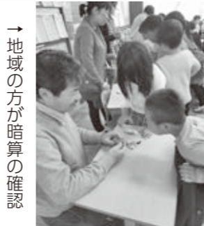
→ 地域の方が暗算の確認