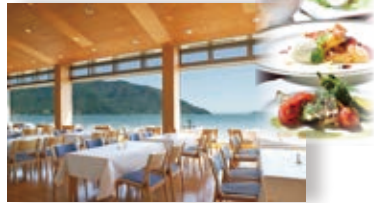
奥琵琶湖マキノグランドパークホテル