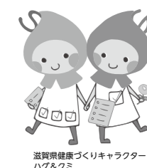
滋賀県健康づくりキャラクター ハグ＆クミ