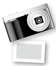
秋彼岸 北川 民子(高島)