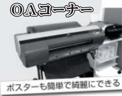
OAコーナー ポスターも簡単に綺麗にできる