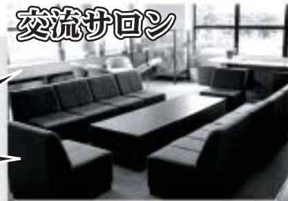
交流サロン 広～いスペースで ゆっくり話せる、憩いの場

たかしま市民協働交流センターは、高島市内のNPOやボランティアグループ、自治会などの活動や交流を支援し、市民と市民、市民と行政とを結び交流の輪を広げ、地域活動をお手伝いする高島市民のための施設（交流センター）です。 市民の多様なニーズに応えるため、センターには各種の設備や備品、そして市民の皆さんが交流できるサロンを備えています。お気軽に専任スタッフへお声かけください。