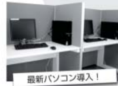
PCコーナー 最新パソコン導入!