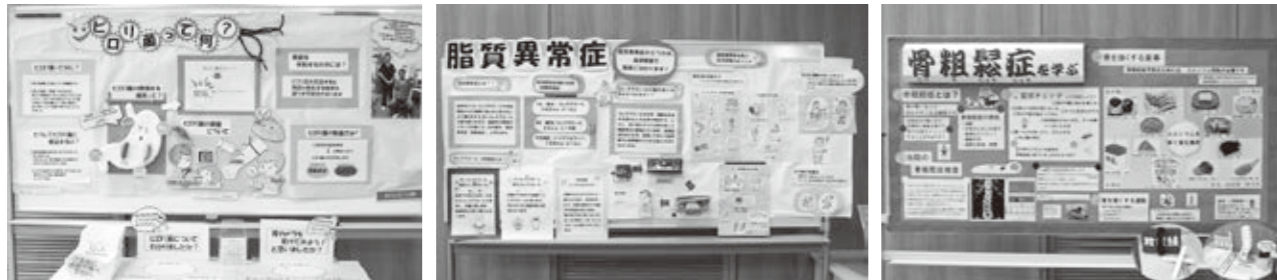
模型などを使用して分かりやすく掲示しています