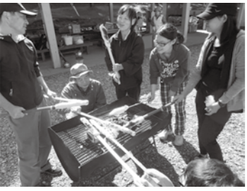
竹パン作りを学習

子どもたちの可能性を引き出す人材育成を目的に、子どもたちと楽しく活動するための基礎知識や技能、安全管理などについて学ぶ「子