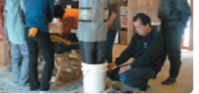
▲作ったおかしを圧縮しています