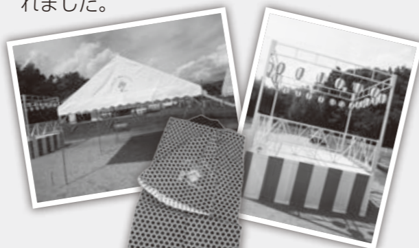
テントやはっぴ、やぐらなど

一般財団法人自治総合センターが実施しているコミュニティ助成事業（宝くじ助成）を活用し、マキノ町沢区が夏祭り用品を整備されました。