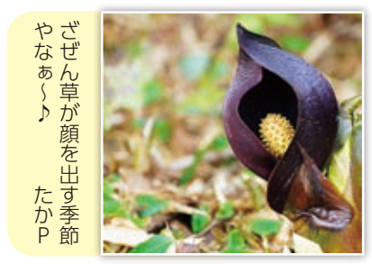
ざぜん草が顔を出す季節やなあ〜♪ たかP