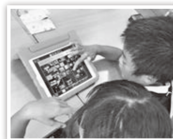
生活科の授業のようす

ICTを活用した授業づくりを進めています。令和2年度から本格実施となる新学習指導要領では、情報化社会の進展を見据え、児童生徒がICTを活用する授業づくりが求められています。市内小中学校では、本年度10月からタブレット端末を取り入れた授業を行い、学びを深めています。授業では、児童生徒がタブレット端末で撮りためた写真や動画、インターネットで調べた情報などをもとにして、自分の考えを整理したり、発信したりしています。