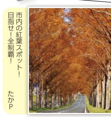
市内の紅葉スポット! 目指せ!全制覇! たかP

スマートフォンや携帯電話などからの応募も大歓迎!また、市ホームページではカラーで掲載!