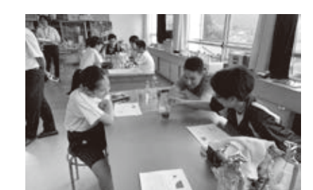
理科の実験のようす

2月に立命館大学ワークキャンプとして朽木中学校に訪れた学生7人から、部活動や学習等に協力したいと申し出があり、今回の企画が実現しました。朽木中学生は2日間合わせて約30人が参加し、普段触れ合う機会が少ない大学生と部活動指導(陸上)やクイズ形式のグループ学習、理科の実験などを通して交流を楽しみました!