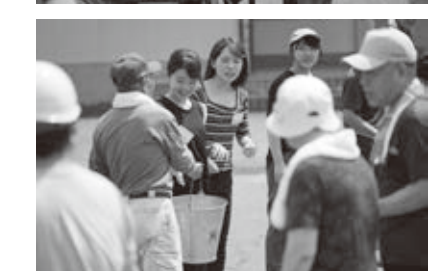
防災訓練のようす

また、受け入れ地域である角川区の防災訓練では立命館大学ワークキャンプに参加した学生ら4人も参加しました。大学生たちには、区民の方との交流を深め、高島市の生活・文化を知ってもらう良い機会となり、また、とても賑やかな訓練となりました。