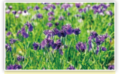
一面広がる花菖蒲! 6月は紫色、青色がよく似合うね♪ たかP

スマートフォンや携帯電話などからの応募も大歓迎! また、市ホームページではカラーで掲載!