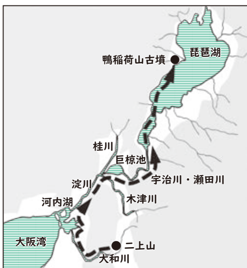
石棺が運ばれたルート図