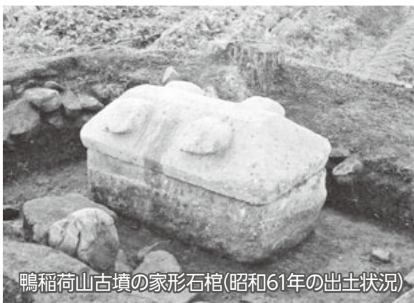
鴨稻荷山古墳の家形石棺(昭和61年の出土状況)