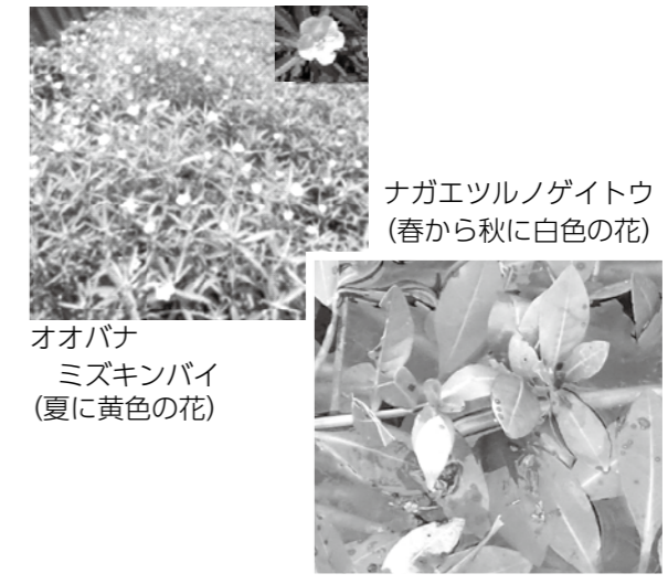
ナガエツルノゲイトウ (春から秋に白色の花) オオバナ (夏に黄色の花) ミズキンバイ (夏に黄色の花)

侵略的外来水生植物の早期発見・駆除にご協力ください！ 琵琶湖の南湖では「オオバナミズキンバイ」や「ナガエツルノゲイトウ」などの侵略的外来水生植物の分布範囲と生育面積が拡大し、大きな問題に発展しています。高島市内の湖岸でも小規模ながらも多くの地点で生育が確認されており、滋賀県や市内のボランティアの皆さんと駆除活動を行っています。 今後も、早期発見・早期駆除を実施するために、下記の外来水生植物を発見された場合は、情報をお寄せください。