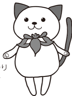
高島市民病院まつり PRキャラクター しまにゃん