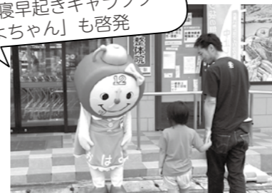
園の早寝早起きキャラクター「おはよちゃん」も啓発