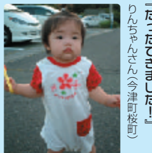
『たったできました!』 りんちゃんさん(今津町桜町)