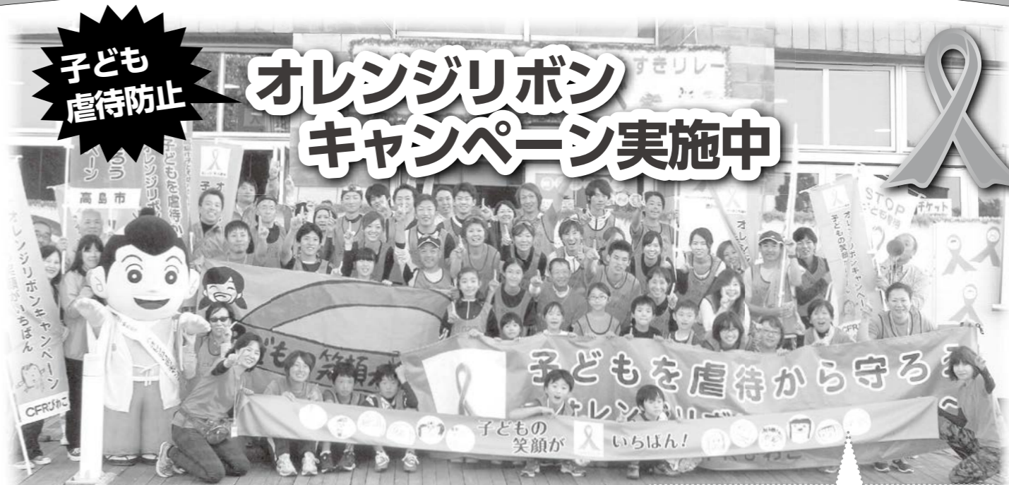
(オレンジリボンたすきリレー参加者の皆さん)

オレンジリボンには「児童虐待防止」というメッセージが込められています。一人でも多くの方々に「児童虐待防止」に関心を持ってもらい、子どもたちの笑顔を守るために一人ひとりに何ができるのかを呼びかけていく活動が「オレンジリボンキャンペーン」です。高島市ではオレンジリボンの啓発活動を推進しています！