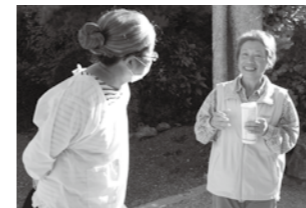
ダミー役の方(左)も、集落内を歩いています。徘徊者の方かどうかは、会話して判断しなければなりません。