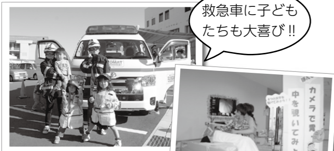
救急車に子どもたちも大喜び!!

病院は病気の時以外にも身近な存在でなければなりません。病気の早期発見のための定期的な健康診断をはじめ、出前講座や健康講座の開催、病院まつりなどを通じて、地域の身近な健康づくりの拠点となるように今後も取り組んでいきたいと思ひます。