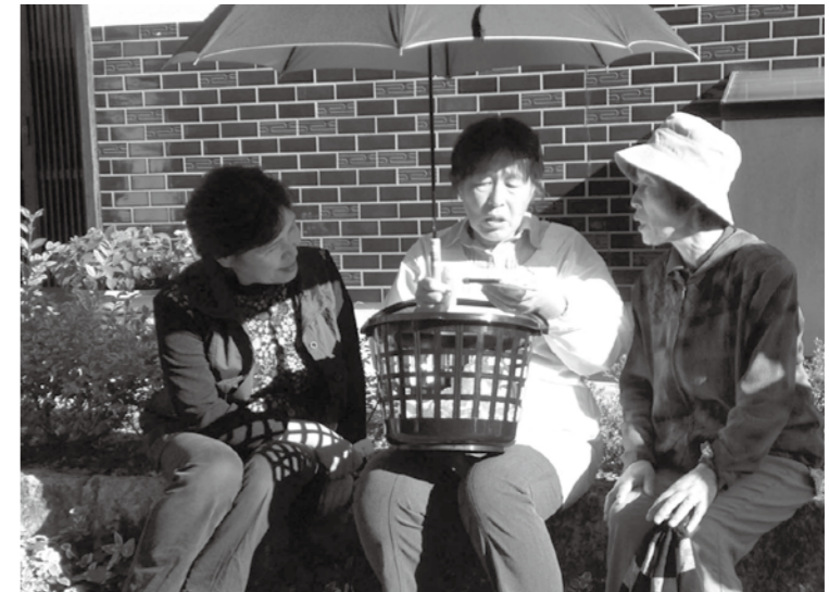
徘徊者役の方(写真中央)を発見した後は、警察と地域包括支援センターに連絡。迎えが来るまで、会話をして落ち着いてもらいます。