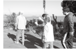
グループに分かれ、区内を歩いて捜索。

若年性認知症に関するご相談については、地域包括支援センターまでお問い合わせください。