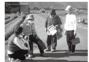
10月18日(土)、今津町浜分区で、市内で2例目となる、「認知症の方の一人歩き(徘徊)保護訓練」を実施しました。今回は

市で作成した「認知症(疑い)の方の一人歩き(徘徊)対応マニュアル」の作成後初めての訓練です。行方不明になられた方を早期に見つけ保護できるように、地域住民だけでなく、警察や介護施設の職員の方との連携を試みました。 訓練にあたっては、事前に区民の方に認知症サポーター養成講座を受講してもらい、認知症について学んでいただきました。そして当日は、浜分区長、民生委員、福祉推進委員、区民14人が参加。行方不明になられた方の情報を市から提供し、その情報をもとに、3グループに分かれ区内を探索し、保護までの一連の流れを実践していただきました。