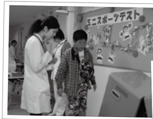
(ミニスポーツテスト)